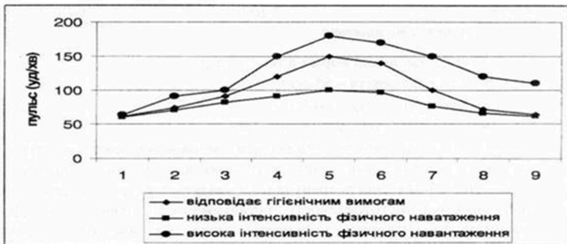
Рис. 1. Фізіологічна крива заняття з фізичної культури у старшій групі.

Якщо заняття з фізичної культури проведено методично правильно, фізіологічна крива має двовершинну (або одновершинну) параболічну форму (рис. 1).